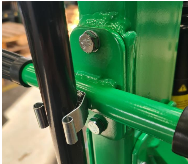
Abbildung 5 Montage Griff mit Pumpenhebelarretierung