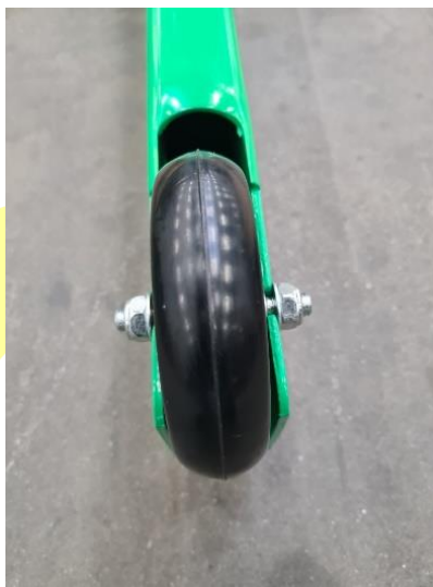
Abbildung 1 Montage Lasträder