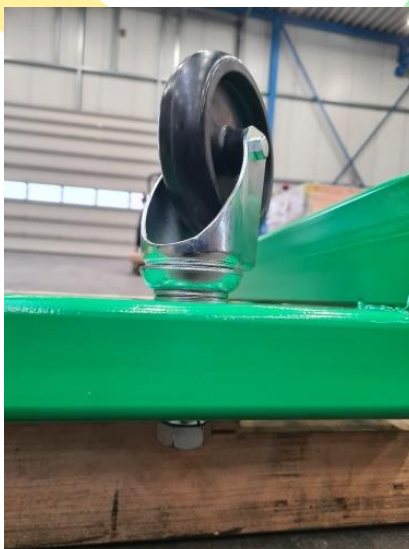
Abbildung 2 Montage Stützräder