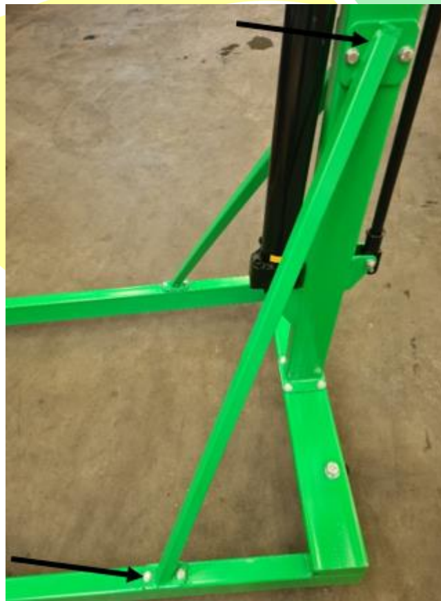
Abbildung 4 Montage Stützstreben