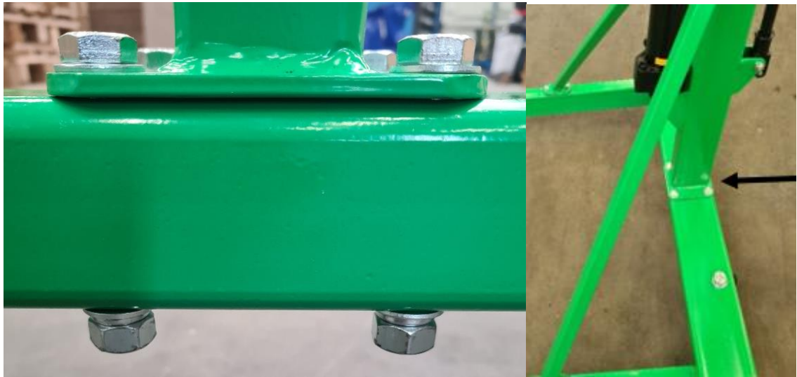
Abbildung 3 Montage Mast am Fahrgestell