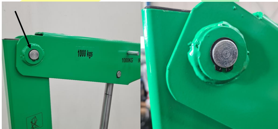
Abbildung 6 Montage Lastarm